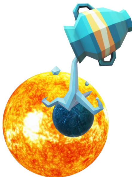
熱中症は、体内に熱がこもってしまいますので、その時は身体を冷やしましょう。