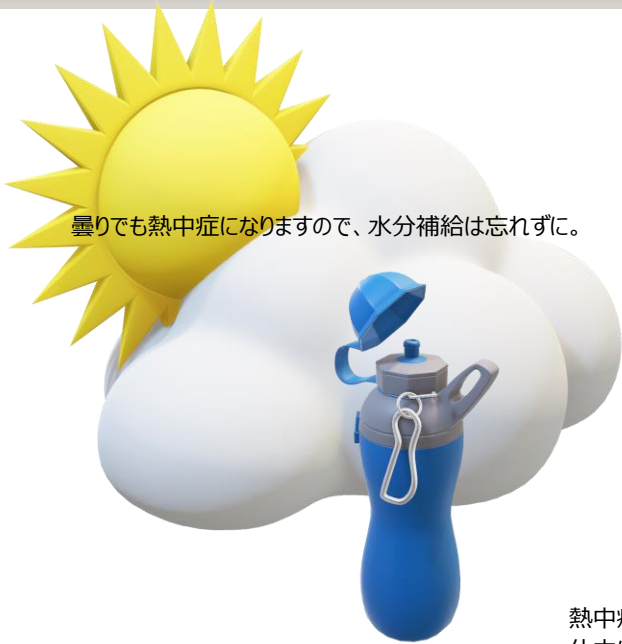
曇りでも熱中症になりますので、水分補給は忘れずに。

夏です！暑い毎日が続いていますね。熱中症にならないように注意・対策をしていきましょう。